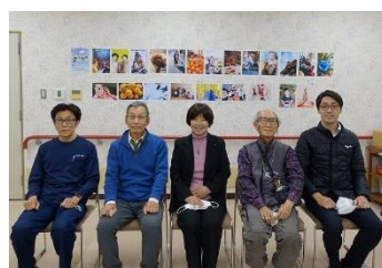
審査委員の皆さん

『わが家の冬の楽しみ』をテーマに開催した「わが家の冬の楽しみ写真コンテスト」(応募期間 11月7日～11月30日)は皆さまから22点のご応募がありました。見る人が元気になるお写真を届けていただき、ありがとうございました。厳正な審査の結果、入賞作品5点が決定しましたので、審査結果を発表いたします。