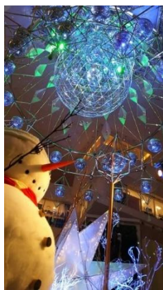
「雪だるまは願う」 やつくん

入賞には至りませんでしたが、他の応募作品もご紹介いたします！ どの作品もオリジナリティ溢れる素敵なものばかりでした。※順不同