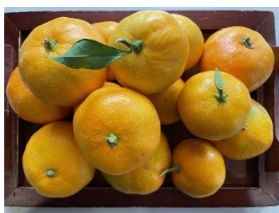
「みかんでほっこり」 ありま