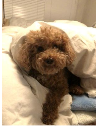
「冬のしらせ」 もちきん