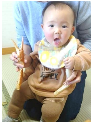
「カニだぞう」 とあ坊