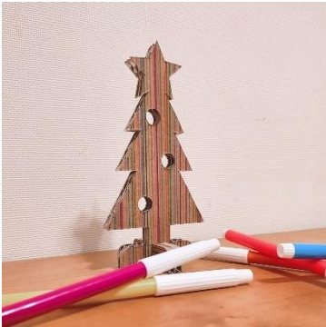
「ダンボールツリーづくり」 Shuzy