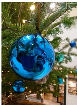
「あおが大好き」 パパとあお