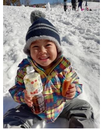
「雪でいっぱい」 ひかりん