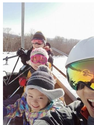
「家族でスキー」 へむへむ