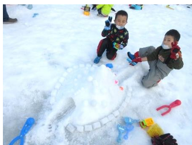
「今年も雪遊びに行きたいな」 やぎちゃん