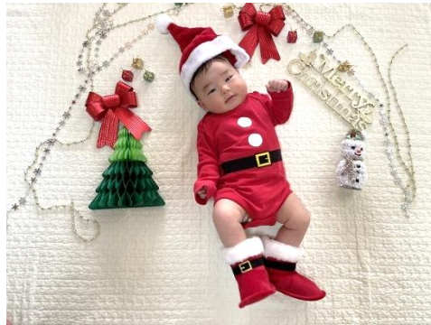
「わが家の小さなサンタさん」 ゆったん