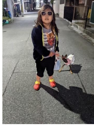
「冬の空の粋な散歩」 ☆リンク☆